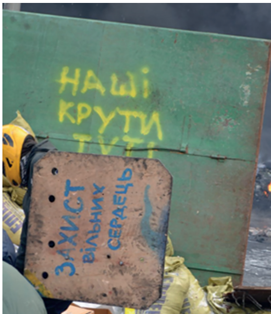
Ил. 7. Щит на Грушевського.

Таким чином, протистояння з В. Януковичем та провладними політиками переводилося з внутрішнього на рівень зовнішнього конфлікту з кремлівським режимом. Уже у січні 2014 р. під час протистоянь на вулиці Грушевського з’явився щит «Наші Крути тут» (ил. 7).